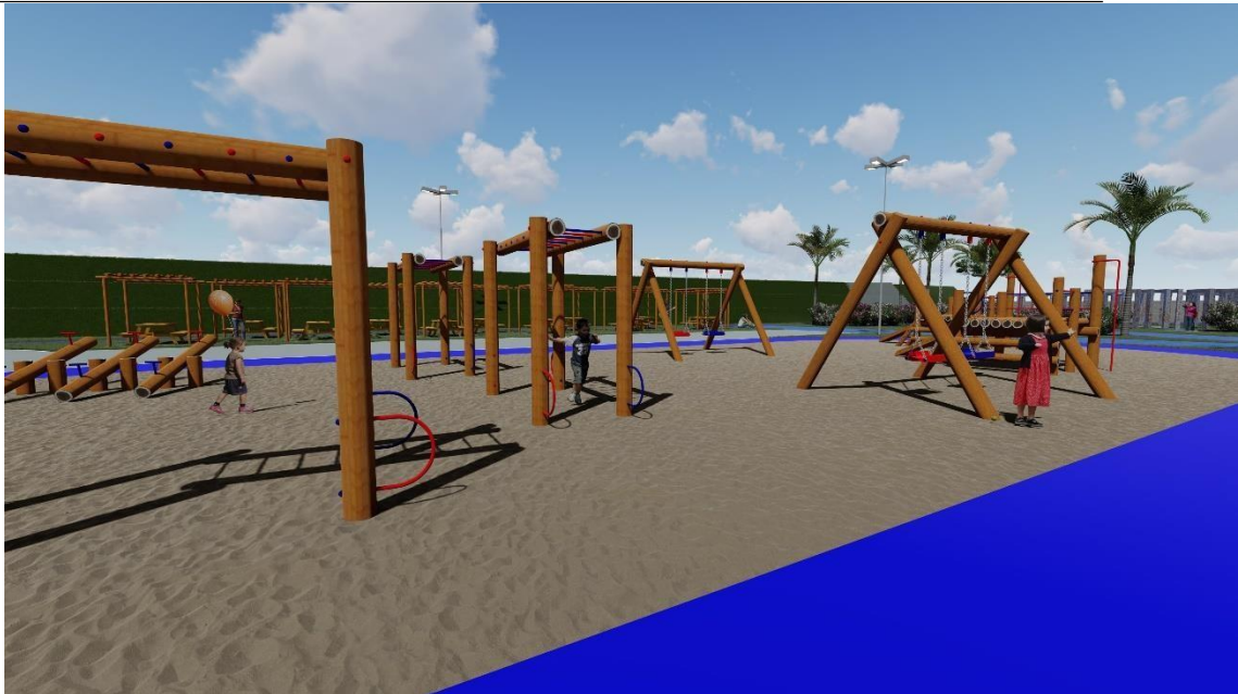
Figura 7. Playground.