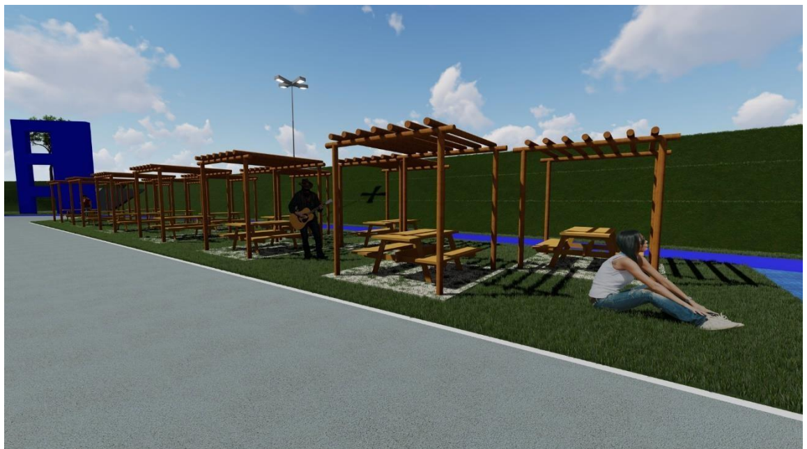
Figura 8. Espaço Piquenique

Poucas remoções serão feitas, já que quase não há construções nem pisos na área da Praça. Alguns postes serão relocados e/ou retirados para a compatibilização com o Projeto Elétrico do local.