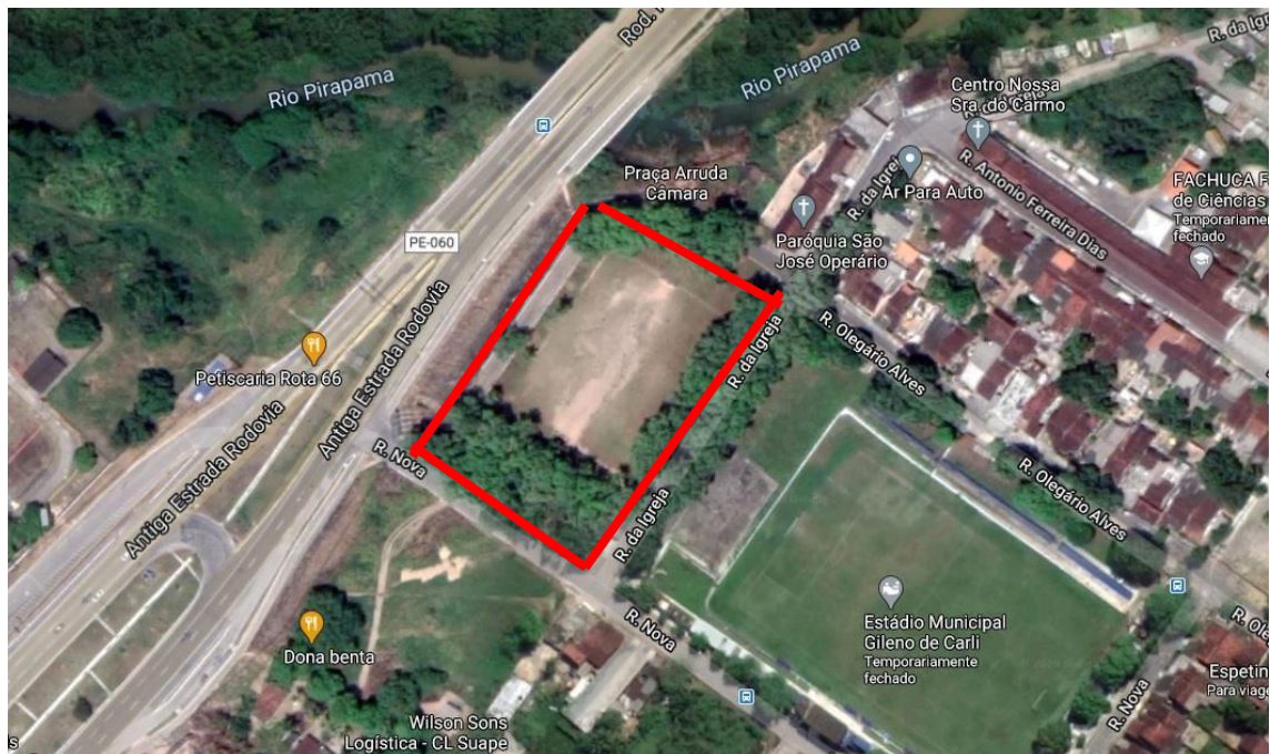
Figura 1. Localização do terreno da Praça Parque Destilaria.

A praça projetada do Parque Destilaria está situada no bairro de mesmo nome no Município do Cabo de Santo Agostinho - PE. Este município apresenta como limítrofes: ao norte, os municípios de Jaboatão dos Guararapes e Moreno; ao sul, o município de Ipojuca; a leste, o oceano Atlântico; e a oeste, os municípios de Escada e Vitória de Santo Antão. O Cabo de Santo Agostinho dista 33 km da capital do estado, Recife, e possui, em seu sistema viário principal, vias das instâncias administrativas federal, estadual e municipal, que funcionam como importantes corredores metropolitanos e eixos de ligação intermunicipal.