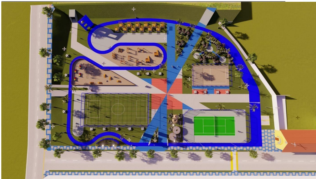
Figura 2. Layout da Praça Parque Destilaria.

O terreno destinado à Praça está localizado entre o Estádio Gileno de Carli e a Rodovia BR-101 Antiga. A área total destinada à praça é de 10.540,00m 2 e tem três fachadas de contorno, uma a BR 101, importante via do turismo no litoral sul de Pernambuco, outra o Estádio e na terceira para a Paróquia São José Operário, situado à Rua Antônio José Veloso da Silveira, nº 207.