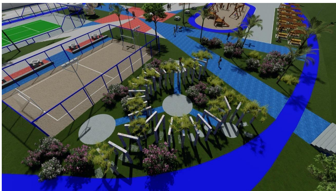
Figura 6. Área destinadas aos esportes.